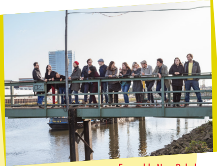
Ensemble New Babylon