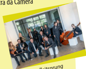
Ensemble Zeitsprung